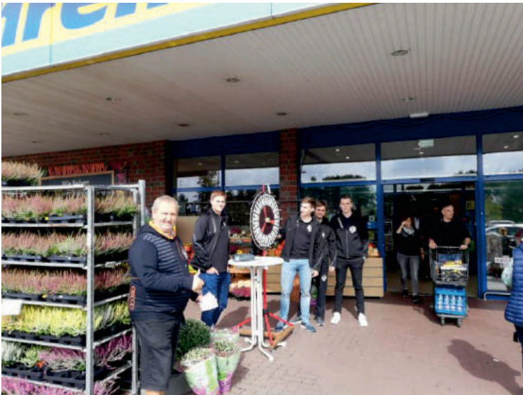
Bundesligateam bei EDEKA Behrens im August 2019