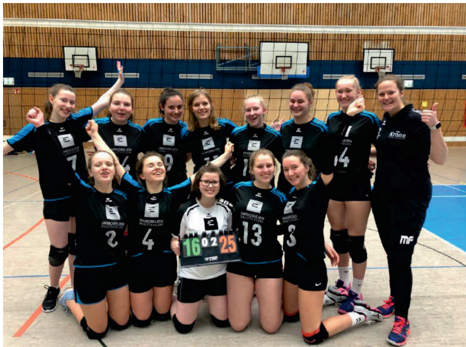
U 20 Mädchen (Jahrgang 2001 und jünger) 3. Platz Bezirksmeisterschaften

Die U 16 Mädchen haben bei der Bezirksmeisterschaft den 5. Platz erkämpft, während die U 20 Mädchen auf das Siebertreppchen kamen und den 3. Platz erreichten.