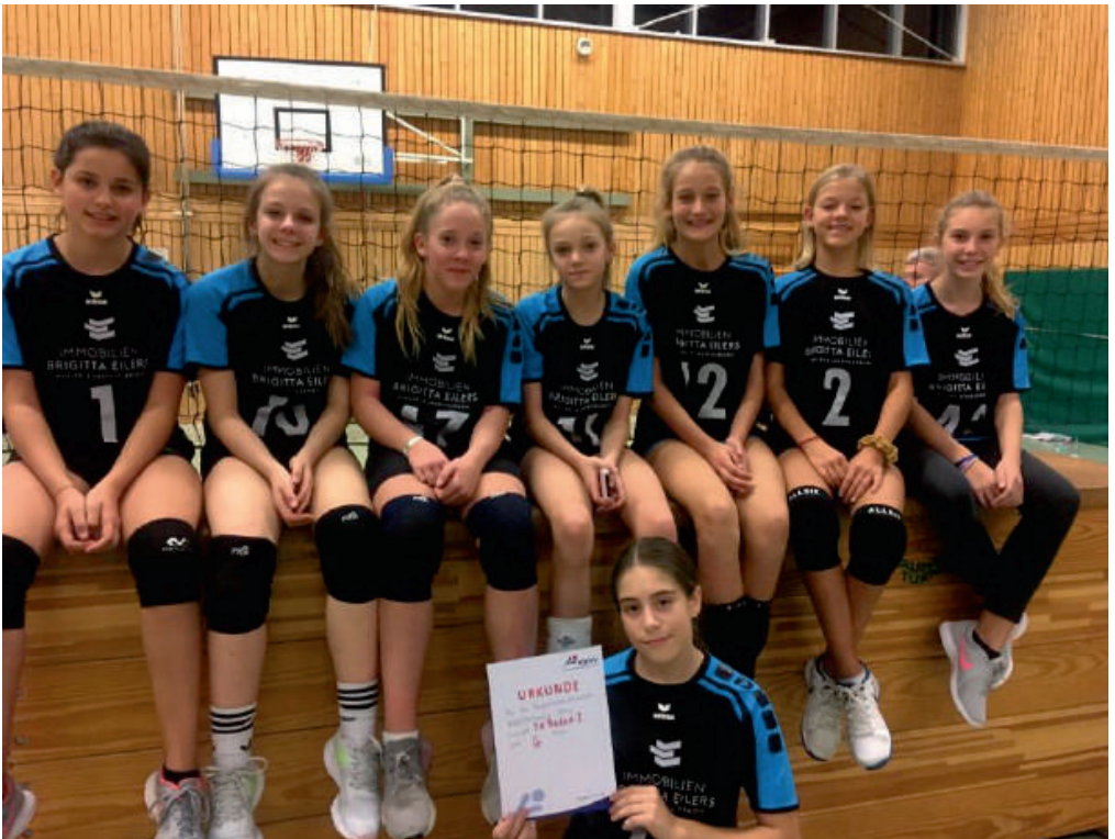
U 14 Mädchen (Jg. 2007 und jünger)

Jugendmeisterschaften: Bei den Qualifikationen zur Bezirksmeisterschaften belegten die U 13-Mädchen einen 5. Platz, die U 14 Mädchen einen 4. Platz und die U 18 Mädchen den 4. Platz und kamen allesamt leider nicht weiter.