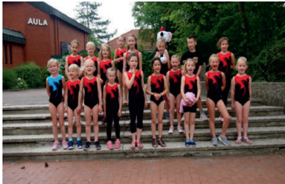
Der 1. Wettkampf für die Montagskinder